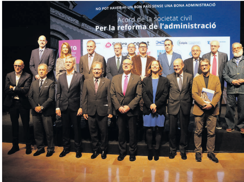
Foto de família d'alguns dels principals representants del FERA / AGN