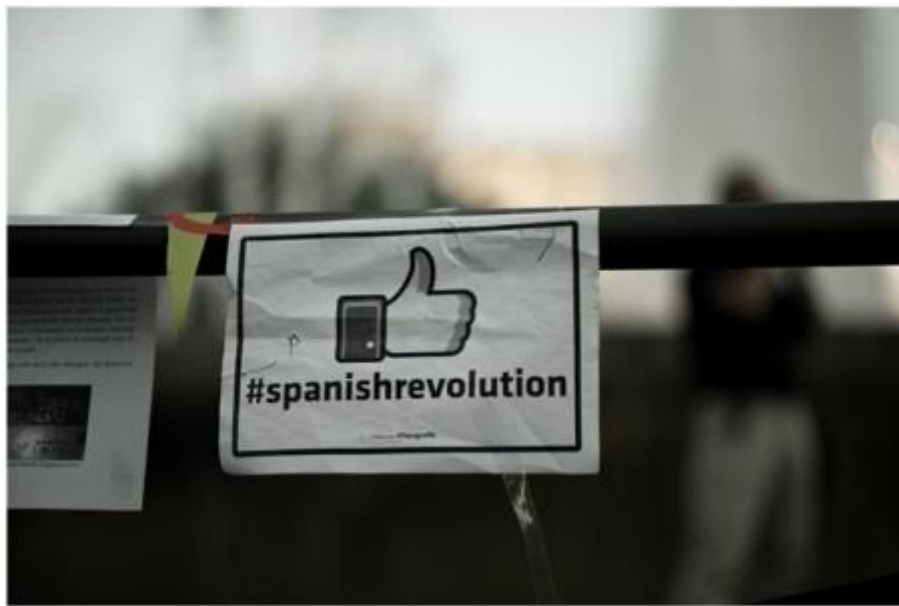
'Indignats'. Autora: Julien Lagarde